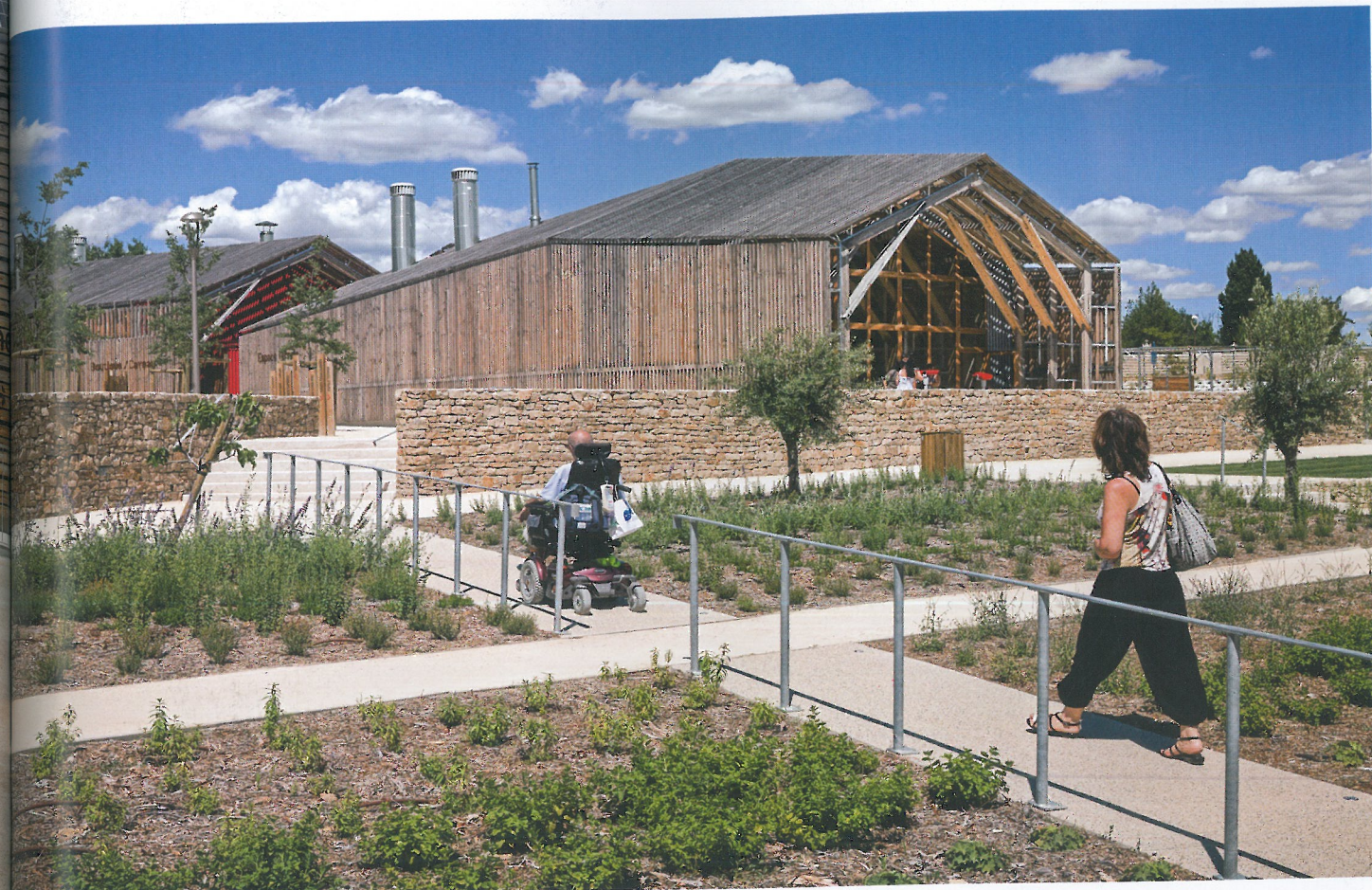
Empathie Viavino est en cohérence avec le territoire où il prend racine: il exprime une relation unique entre la nature et la culture, entre les habitants du Pays de Lunel et leur milieu méditerranéen, entre les matières et les savoir-faire spécifiques qu'elles inspirent.

À l'entrée du site, la maison du tourisme intercommunal reçoit familles et groupes dans un espace d'accueil qui sent bon le bois, et propose un atelier du goût pour la dégustation