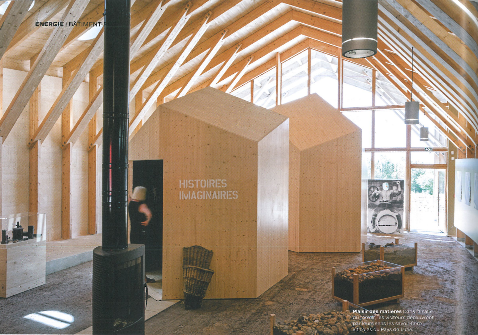
Plaisir des matières Dans la salle du terroir, les visiteurs découvrent par leurs sens les savoir-faire viticoles du Pays de Lunel.