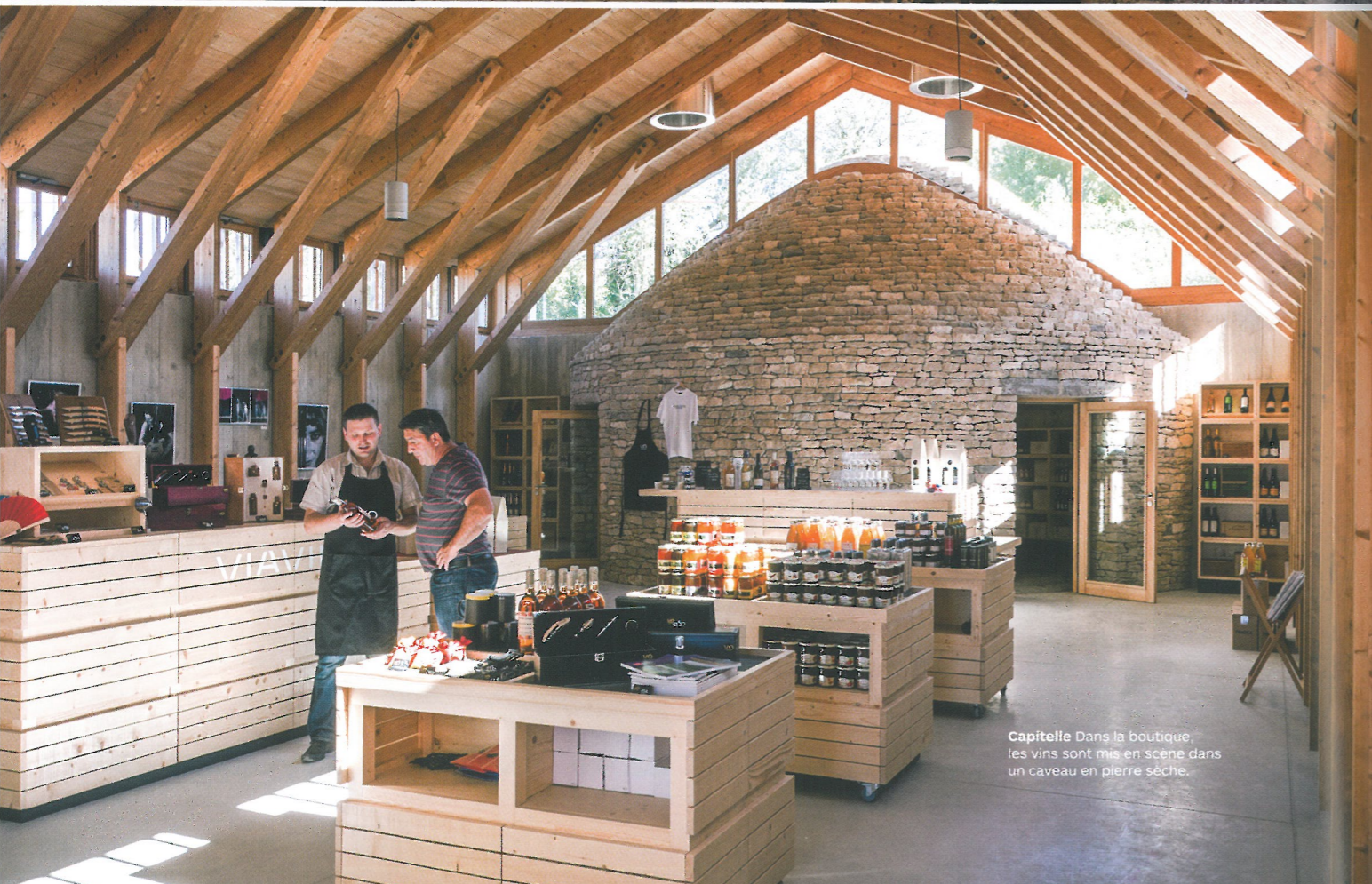
Capitelle Dans la boutique, les vins sont mis en scène dans un caveau en pierre sèche.