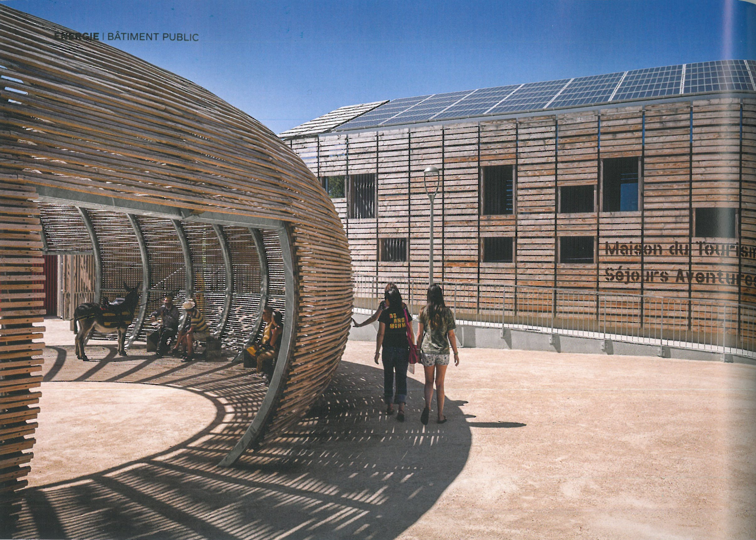
Animation joyeuse Le « panier renversé » du Patio est le cœur animé de Viavino. Son ouverture zénithale dessine au sol une scène qui invite les artistes à des spectacles improvisés.

Saint-Christol, sa coopérative viticole, ses arènes... Dans la zone d'attraction de Montpellier, ce village de 1400 habitants, dont la population a doublé en cinquante ans, affirme son identité languedocienne et développe des activités en circuit court, ancrées dans les compétences de son terroir. Bordé par des quartiers résidentiels, son pôle œnotouristique est niché au pied du bourg sur une parcelle de 2 hectares. Deux ans après son ouverture en juin 2013, il avait déjà attiré 95000 visiteurs: groupes scolaires, amateurs de dégustation sur la route des vins, aficionados des courses camarguaises, gourmets attirés par le restaurant, participants à des séminaires d'affaires... et adeptes du tourisme architectural!